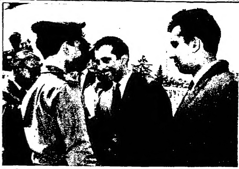
جلته الملك اعظم يردع سمو الامير محمد نقيب جلته لدى مفارقة الجيش مطار عمان امس وفي الصورة سيادة رئيس الديوان الملكي الهاشمي